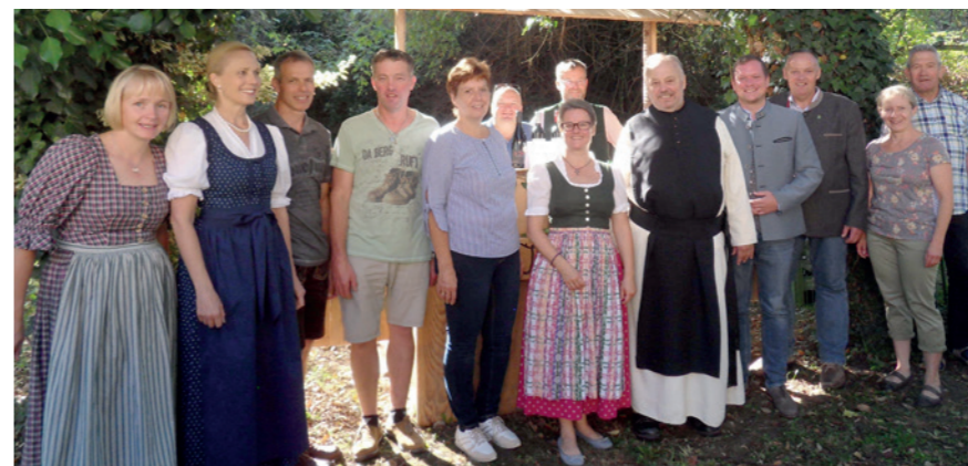
Zahlreiche helfende Hände sorgten für ein wunderbares Pfarrfest bei strahlendem Sonnenschein.

IMPRESSUM: Medieninhaber, Verleger und Herausgeber: r.k. Pfarramt Wilhelmsburg, Hauptplatz 5, 3150 Wilhelmsburg. Konto der Pfarre Wilhelmsburg für freie Spenden: IBAN: AT31 3244 7000 0070 0443 Grafik: textART, Sandra Gruberbauer. Für den Inhalt verantwortlich: Pfarrblattteam Wilhelmsburg. Fotos: Cover: Pfarre Wilhelmsburg; textART, zur Verfügung gestellt von der Pfarre Wilhelmsburg. Auflage: 2.600 Stück. Druck: Druckerei Rutzky GmbH, 3100 St. Pölten.