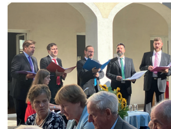
Männerensemble „Klavier & Fünf“.