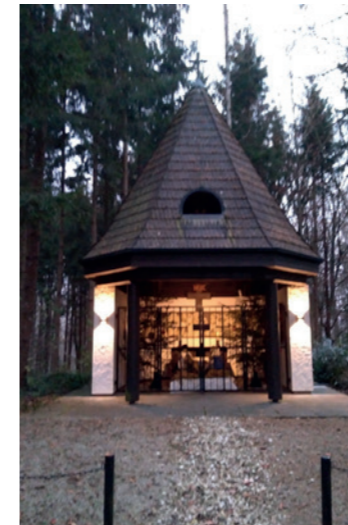
Hubertuskapelle am Rametzberg